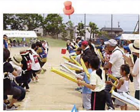
応援にも力が入ります