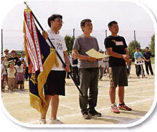
優勝の馬替新町会