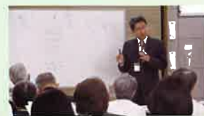
4月24日(水) 開級式と講演会 「介護とお金」