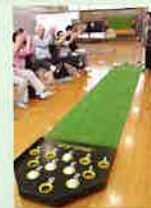
6月13日(木) スカットボール やった! パーフェクト