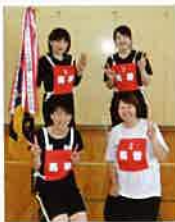
優勝の馬替町会Aチーム

今回ソフトボールは雨天の為前日に中止が決定し、ソフトバレーボール大会のみ行われましたが、体育館では大勢の応援の中熱戦が繰り広げられました。